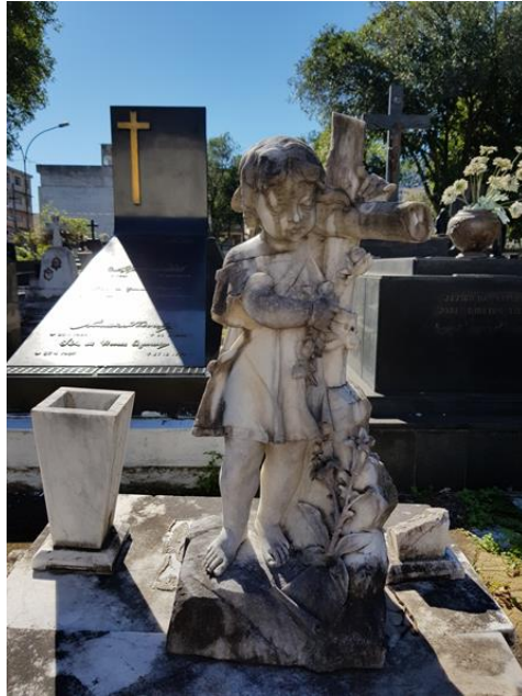
Figura 7. Monumento em mármore.

Uma questão que chama a atenção no cemitério de Santo Antônio é que, de forma geral existem diversos túmulos sem quaisquer identificações, tanto da escultura como da pessoa ali enterrada (Fig. 8).