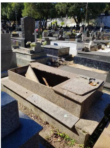
Figura 4.

Quando alguma parede está quebrada, com matos, ou árvores que danifiquem as sepulturas (Ver figura 4 e 5), elas são consideradas abandonadas. As obras em um jazigo podem ser realizadas de acordo com a vontade dos familiares ou naquelas que se encontram em estado de ruína, através de edital e exumação dos ossos.