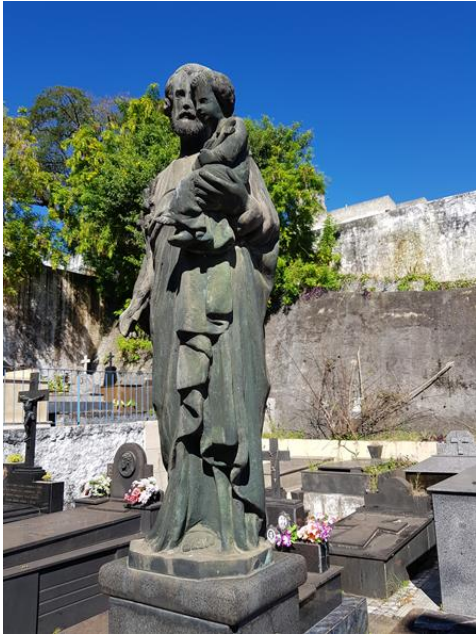
Figura 6. Monumento em bronze.

A preservação também é impactada diretamente pela questão da resistência dos materiais empregados na confecção tanto do túmulo quanto de seus ornamentos. As ações do tempo e a falta de manutenção em certos materiais é visível. O bronze quando exposto ao ar e umidade, pode oxidar e desenvolver uma camada esverdeada (Fig. 6), já o mármore exposto a poeira poderá apresentar manchas escuras em torno da mesma (Fig. 7).