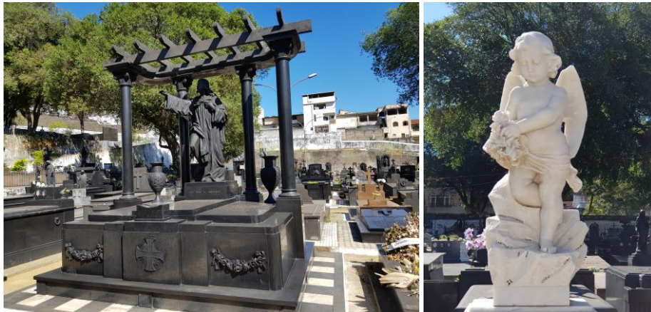
Figura 9. Mausoléu em granito com estátua em bronze. Figura 10. Estátua em mármore.

serviços de limpeza, para que o jazigo seja mantido em perfeitas condições. O produto de limpeza mais usado nas superfícies dos túmulos e nas esculturas é o hipoclorito. Um exemplo do bom estado de conservação desses túmulos pode ser visto nas figuras 9 e 10.