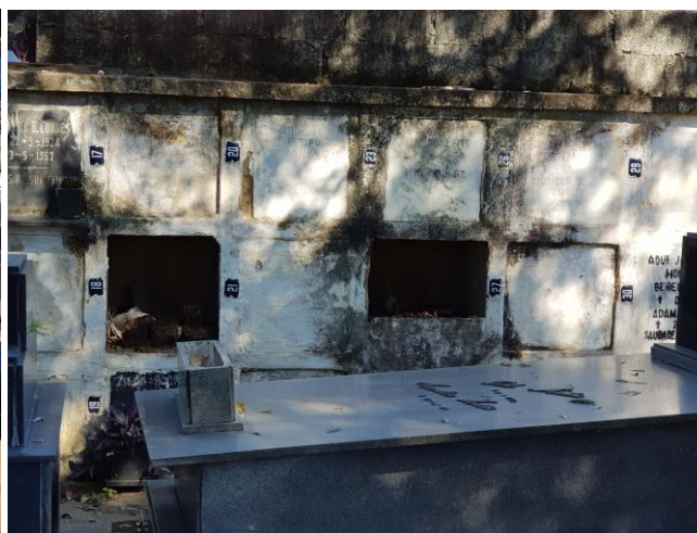
Figura 5.