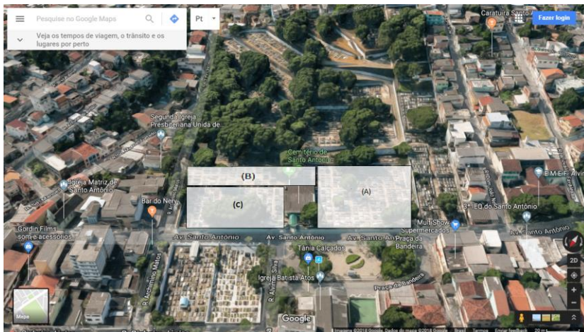
Figura 1: Área mapeada do 1º pavimento do cemitério de Santo Antônio.

a) Trabalho de campo com visitação ao Cemitério de Santo Antônio, dando continuidade ao processo iniciado para o estudo das obras de Carlo Crepaz naquele cemitério, objeto de projeto de ICT anterior, projeto que foi revisto e teve o Tema Carlo Crepaz modificado para as esculturas em geral de diversos escultores, pesquisa esta realizada no primeiro pavimento do cemitério restringindo a coleta de dados para os monumentos dos túmulos que possuem datas de 1912 á 1960. Realizou-se os registros fotográficos de todos os túmulos das áreas (A), (B) e (C) (Fig. 1). O registro fotográfico e o inventário dos túmulos, se deu por meio de fichas confeccionadas através da metodologia do IPHAN para bens culturais materiais (SICg) de modo a facilitar a identificação do estado de preservação e conservação das esculturas monumentais. As fotografias e informações de cada túmulo estão sendo registradas em formulários individuais (para cada escultura) na Ficha M301 – Cadastro de bens (Fig. 2), nelas são encontradas descrições do cemitério, escultura, data e representações da mesma.